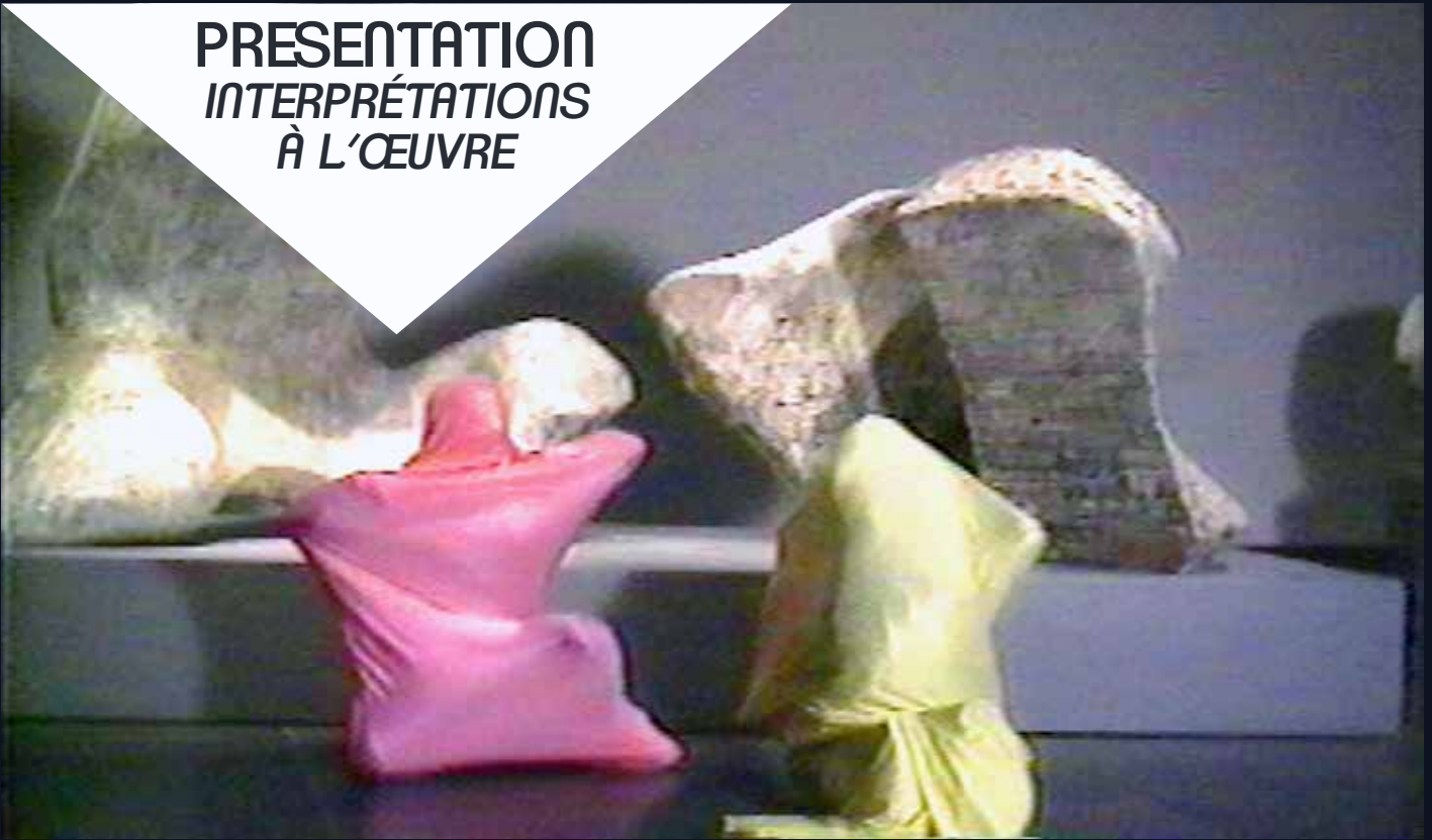
Luis Jacob, Towards a Theory of Impressionist and Expressionist Spectatorship , 2002. Two-channel video (DVD), colour, sound, 51'50 mins.

This exhibition focuses on body language according to its different features. Through the diversity of meanings it contains, in relation to its context, the tradition in which it is inscribed or the audience it addresses. Body language is a multiple, its understanding and interpretation involves learning a vocabulary. For their transmission, gestures can be written, taking the form of instructions or scripts. The works address these aspects in the form of video, installation, documentation, sculptures and performances, all presented in a specially designed scenography between the white cube and the stage. The role of spectators is central to this project, at once in the suggested path, since choreography forms from their movement in the space, and for the perception of the works, which leads them to reflect on their own understanding of body language. The selected artists come from French and Canadian art scenes, offering a mix of viewpoints and research.