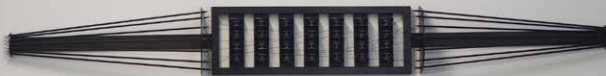
Jennifer Caubet, X.Y., 2015. Acier, flèches, fil, roulements. Sculpture 240x25x15cm. Extension variable. © Jennifer Caubet

L'exposition s'intéresse au langage gestuel selon ses différentes caractéristiques. À travers la diversité de significations qu'il contient, en lien avec son contexte, la tradition dans laquelle il s'inscrit ou selon le public auquel il s'adresse. Le langage gestuel est multiple, sa compréhension et son interprétation impliquent l'apprentissage d'un vocabulaire. Dans le cadre de sa transmission, le geste peut s'écrire, prenant la forme de partitions ou de scripts. Les œuvres présentées abordent ces aspects, sous la forme de vidéos, d'installation, de documentation, de sculptures et de performances, dans un dispositif scénographique inédit entre exposition et scène. La place du spectateur est centrale dans ce projet, à la fois dans le parcours proposé, une chorégraphie qui se forme par sa circulation dans l'espace, et pour l'appréhension des œuvres, qui l'amènent à réfléchir sur sa compréhension du langage gestuel. Tant émergents qu'établis, les artistes choisis sont issus des scènes artistiques françaises et canadiennes, proposant ainsi un mélange de points de vue et recherches.