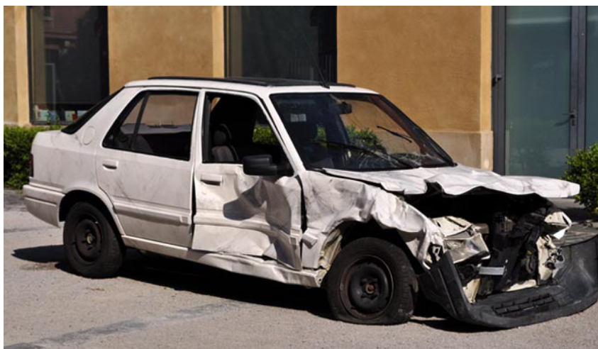
Pimp My Crashing Car , 2011, dispositif sculptural, pictural et sonore, carcasse de voiture accidentée et imitation de marbre. Partition sonore : B.Brazitberg.

Marbre : A.Barron-Cassin. Production : Espace Croix Baragnon, Toulouse. Partenariat : le musée des Abattoirs, Toulouse et Cazenave Auto, Colomiers.