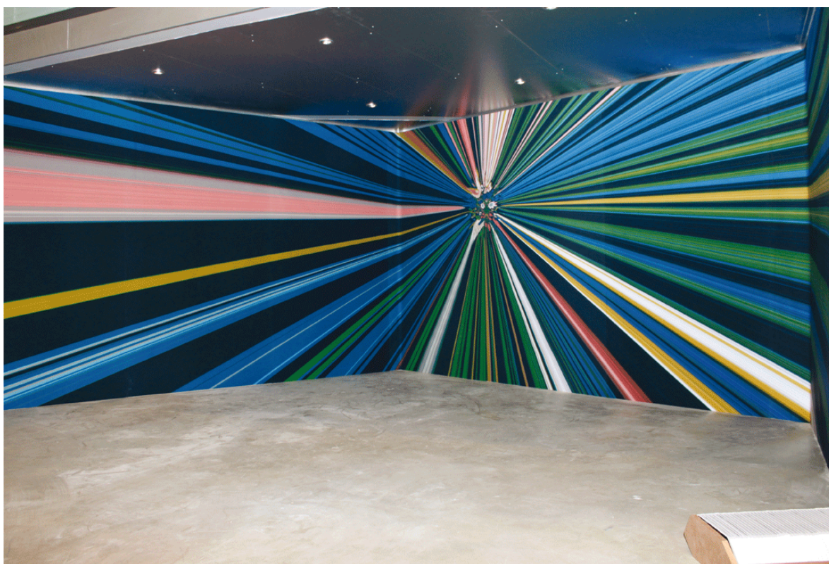
Motif éclaté , 2010, tapisserie, 900cm x 200cm. Motif arts and craft étiré aux dimensions du mur