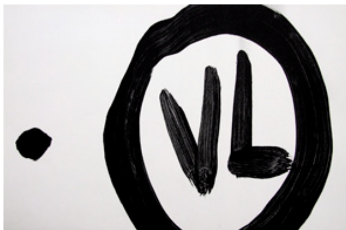
Sans titre, 2010